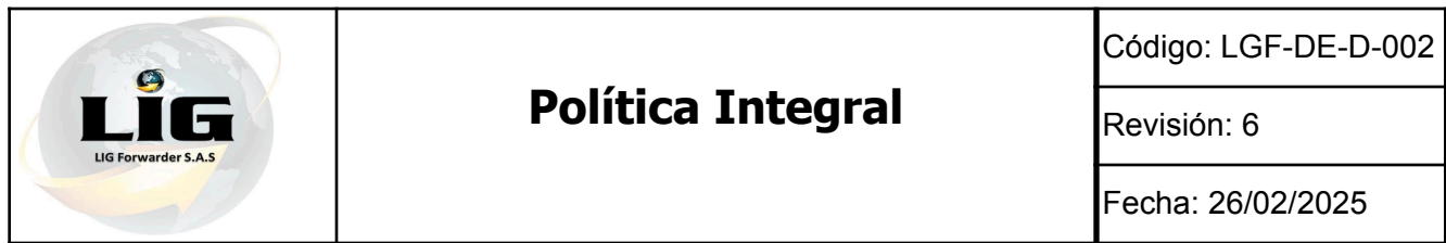
TABLA DE CONTROL DE CAMBIOS